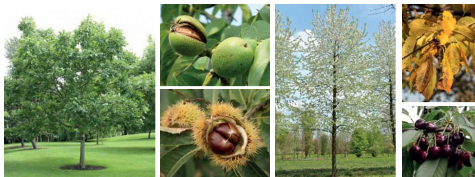
1. Notenbomen ( Juglans ) 2. Tamme kastanje ( Castanea ) 3. Bloesembomen ( Prunus )