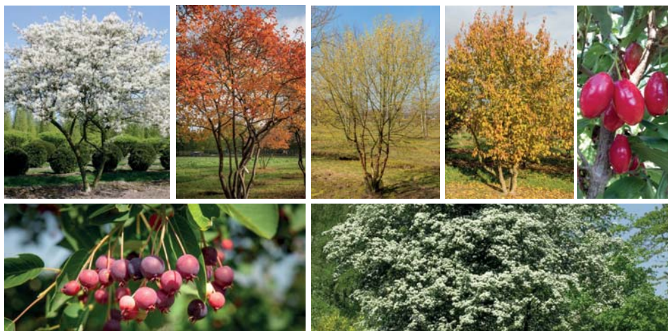
1. Landschappelijke beplanting ( Amelanchier , Cornus mas , Crataegus monogyna )

In het midden van het terrein wordt een tweetal bloemenmengsels aangebracht met enkeljarige en meerjarige soorten. Een mengsel met meer landschappelijke uitstraling en een rijkbloeiend vlindermengsel. Dit geeft niet alleen sierwaarde, maar is ook voor bijen en vlinders een stimulans. Ook de brede oever van de wadi wordt voorzien van een natuurlijk mengsel met (deels bloeiende) oeverbeplanting.