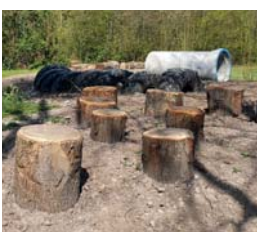
9. stammenparcours staand + liggend