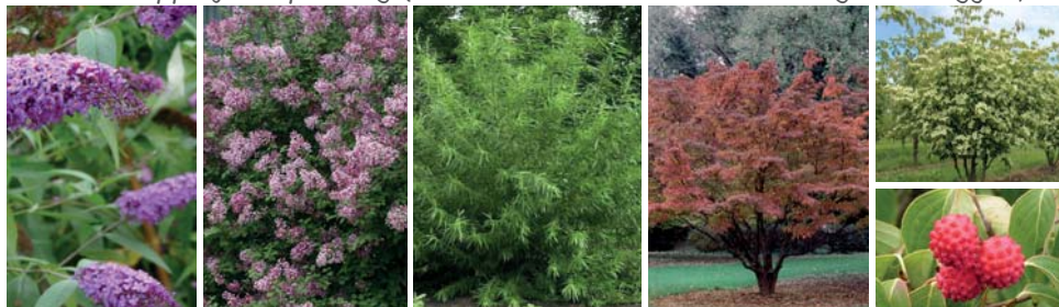
2. Sierheesters ( Buddleja , Syringa ) 3. Struingroen 4. Vruchten ( Cornus kousa )