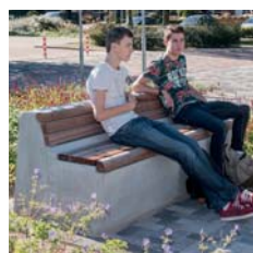
8. solid seats bank