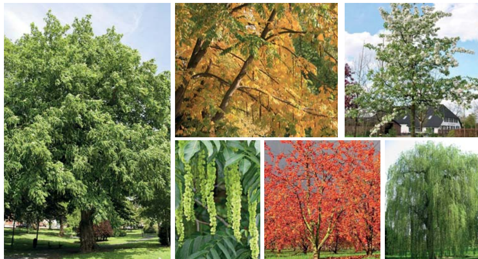
4. Klim-/schaduwboom ( Pterocarya ) 5. Bloesembomen ( Malus ) 6. Treurwilg