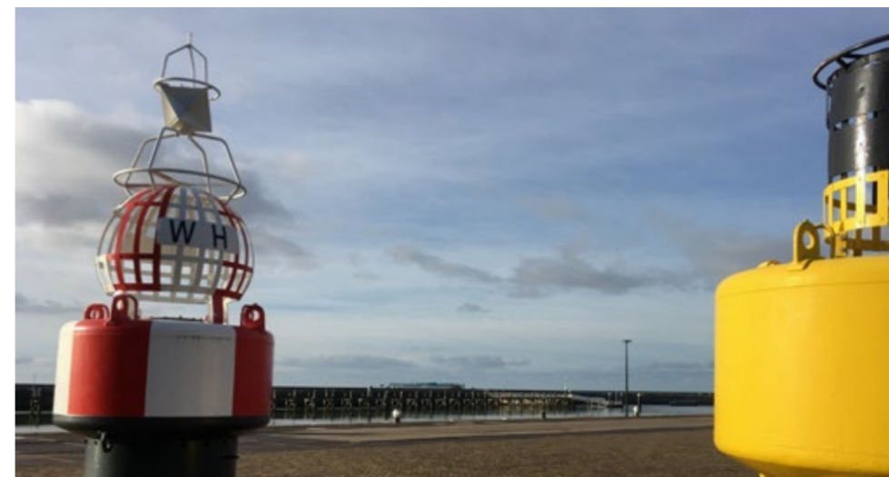
Harlingen, Nieuwe Willemskade

Bij de jaarrekening van 2020, gereed in mei 2021, is er mogelijk meer inzicht in de begroting van het jaar 2021. Dit kan misschien een reden zijn voor aanpassing van de begroting 2021, alhoewel dit in principe niet wenselijk is.