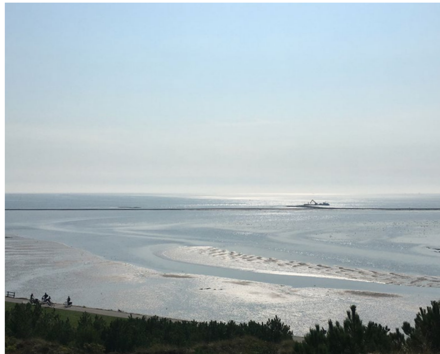
Terschelling, de Dellewal