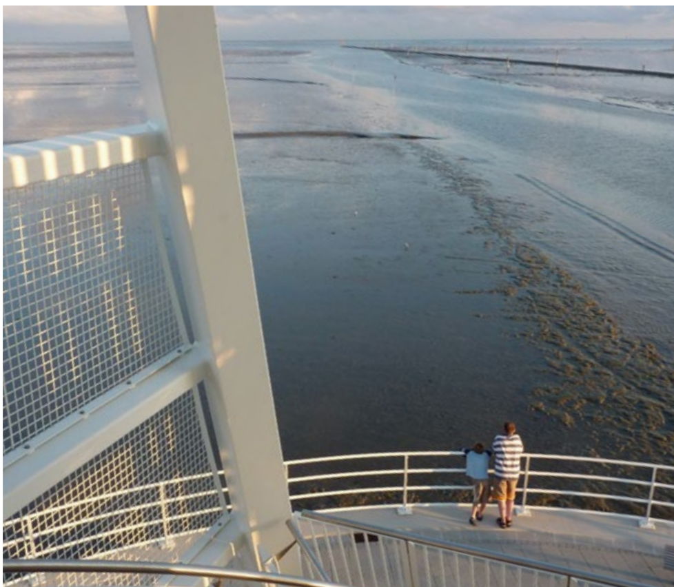
Duitse Wadden, jachthaven Juist

In het begin van 2021 zal hopelijk de Toogdag gehouden kunnen worden. Deze dag organiseert het OBW samen met het Waddenfonds. Centraal staat daarin hoe de Agenda voor het Waddengebied wordt uitgevoerd, welke prioriteiten van de Investeringsagenda zijn gekozen en hoe de ervaringen tot nu toe zijn met de (bestuurlijke) samenwerking zoals de Beheerautoriteit, het Omgevingsberaad en het Bestuurlijk Overleg.