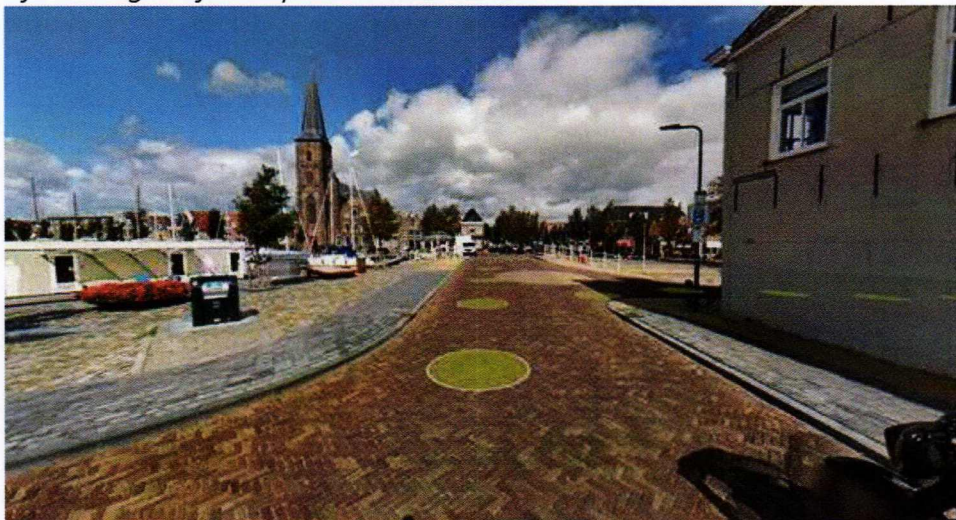
Afbeelding 4: Sfeerimpressie nieuwe situatie.

Al deze punten worden verduidelijkt door de vier weergegeven afbeeldingen. In afbeelding 3 en 4 is te zien hoe de verandering van de straat een positief effect heeft gehad op de overzichtelijkheid van deze straat.