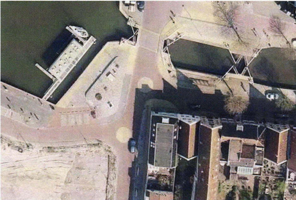
Afbeelding 2: Luchtfoto situatie 2020.