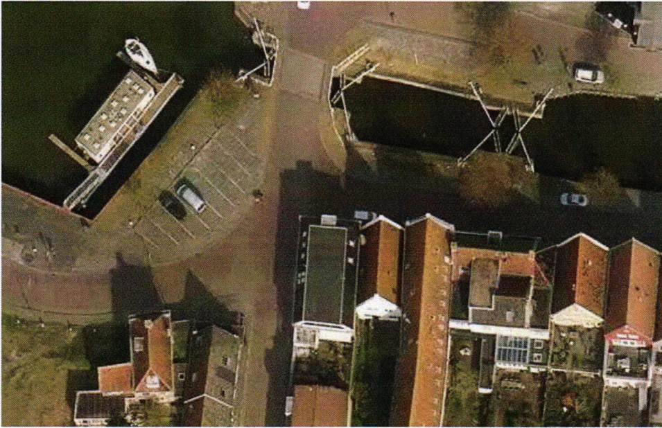
Afbeelding 1: Luchtfoto situatie 2017.