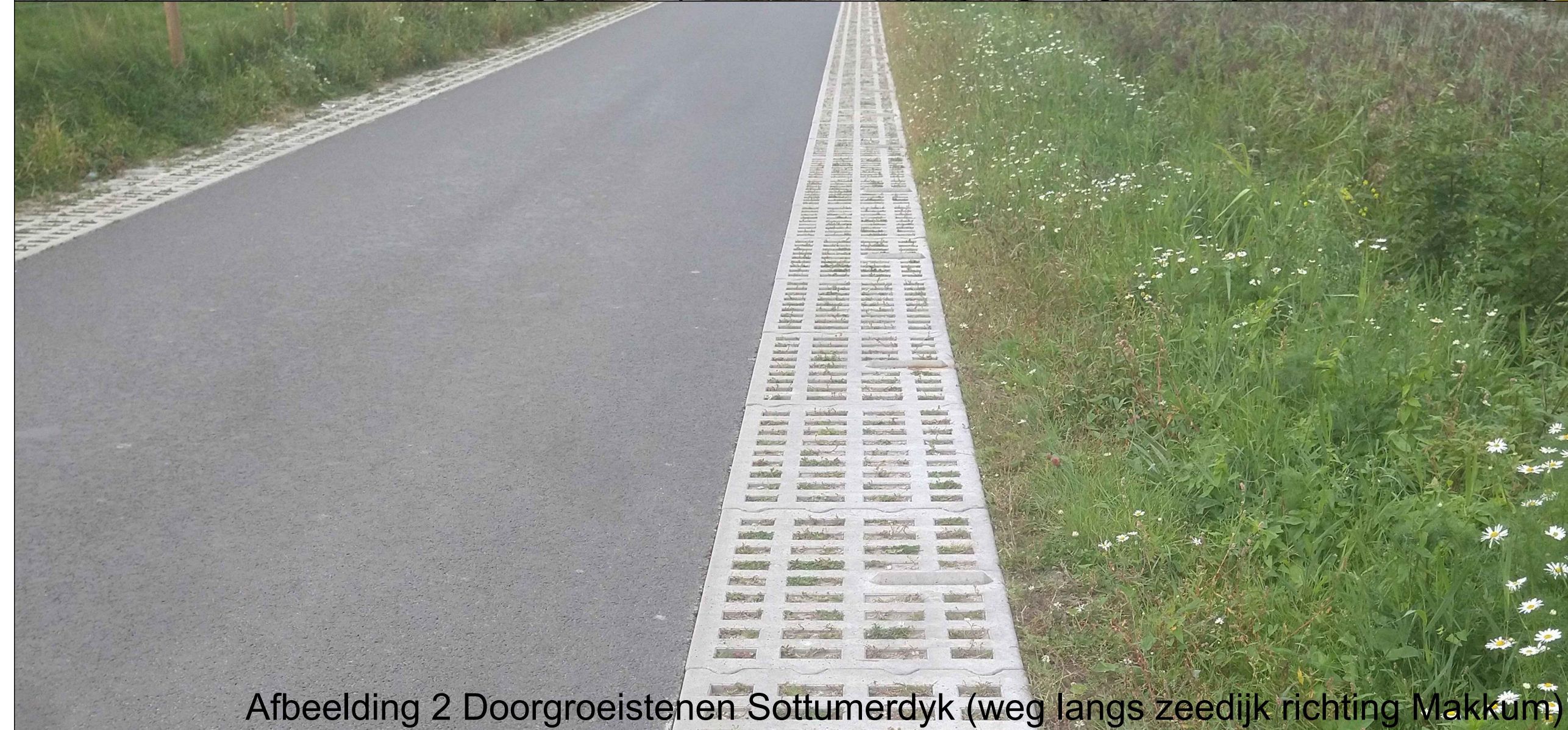
Afbeelding 2 Doorgroeistenen Sottumerdyk (weg langs zeedijk richting Makkum)