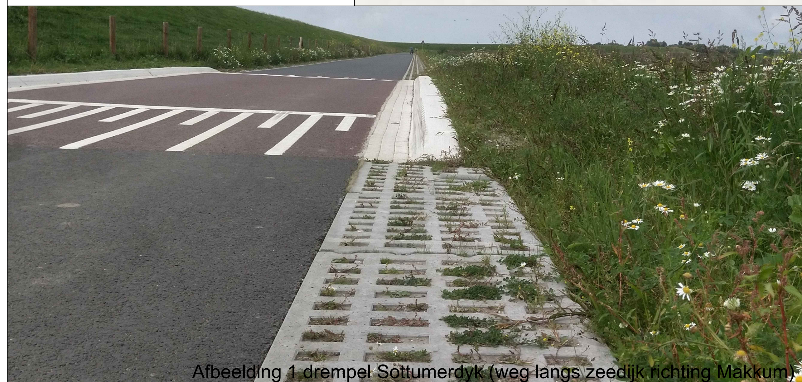
Afbeelding 1 drempel Sottumerdyk (weg langs zeedijk richting Makkum)

Legenda Water Doorgroeistenen Rood asfalt Asfalt