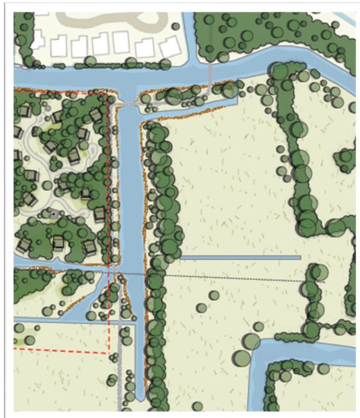
Aan te leggen watergang ten zuiden van het recreatiepark.

Ook wordt tussen het te realiseren vakantiepark en Camping de Zeehoeve een nieuwe watergang aangelegd. Tegelijkertijd met de bodemsanering worden voorbereidende werkzaamheden verricht voor de aanleg van deze watergang. Op onderstaande afbeelding staat waar de watergang komt. Uitgangspunt in het ontwerp voor het recreatiepark is het behoud van de rietkragen en een zone van 10 meter waarin geen recreatiewoningen worden gebouwd. Uiteraard zal ter hoogte van de aan te leggen watergang wel sprake zijn van het verwijderen van riet.