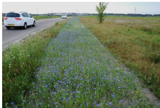
Impressie van een bijenlint

We gaan daarom duidelijk maken waar de bebouwde kom begint. Dit doen we door het aanleggen van een middenberm en twee drempels. Het effect hiervan is dat het verkeer langzamer gaat rijden en er dus minder onveilige situaties ontstaan.