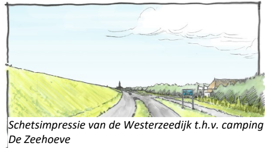
Schetsimpresie van de Westerzeedijk t.h.v. camping De Zeehoeve

Daarnaast verbeteren we de ingangen naar de camping. De bermen langs de Westerzeedijk zijn onderdeel van een zogenaamd 'bijenlint': een aaneenschakeling van bijenvriendelijke beplanting. Daarom worden de bermen ingezaaid met een bloemenmengsel.