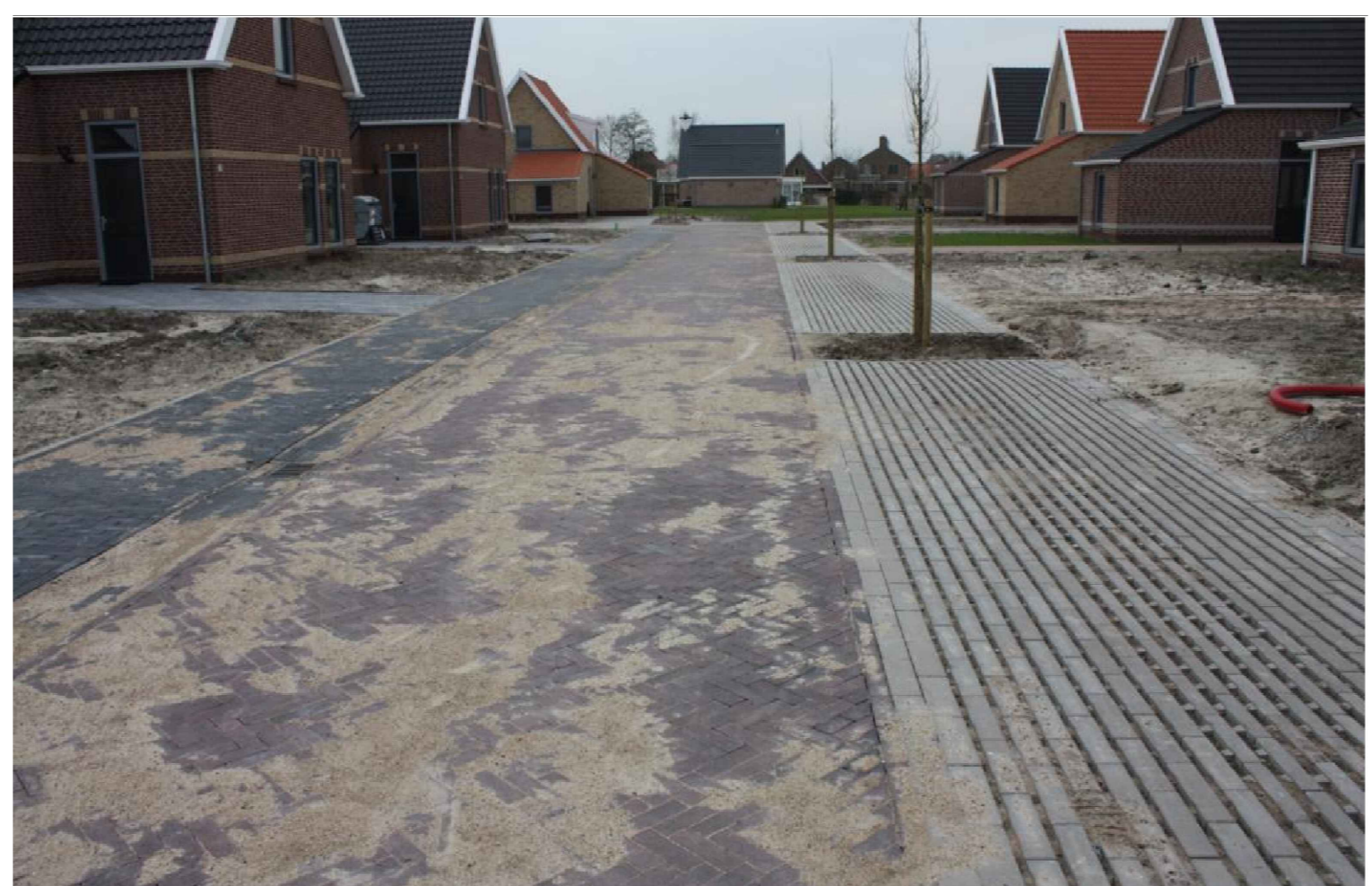
Voorbeeld langparkeerstrook met doorgroei stenen