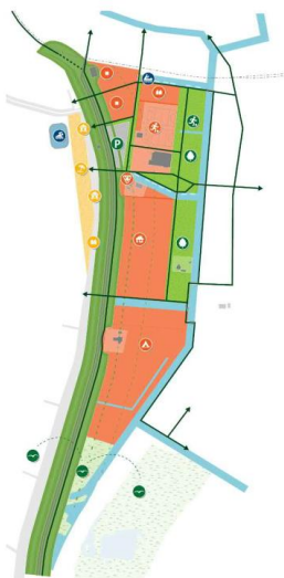
Model 1: Bolswardervaart

Uitgangspunt in alle modellen is het verweven van dijk en strand met de Bolswardervaart en het achterliggende (woon)gebied. Ook gaan alle modellen uit van bereikbaarheid voor auto's vanaf de Westerzeedijk en voor fietsers en voetgangers vanaf alle zijden, door aanleg van nieuwe routes.