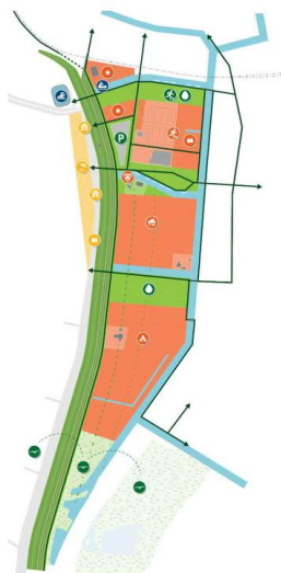
Model 2: Dwarsverbindingen