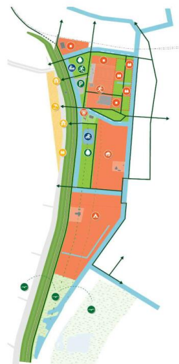
Model 3: Dijk