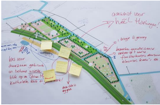
Verzamelde reacties op model 1. Bolswardervaart